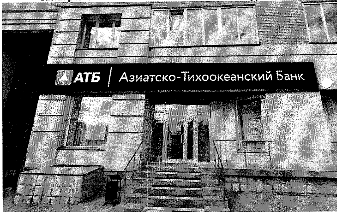
Схема расположения Объекта и Рекламной конструкции

Приложение № 2 к Договору аренды № РК/А 01/10/2022 части несущей стены (фасада) многоквартирного дома для размещения Рекламной конструкции от «26» октября 2022 г.